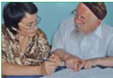
Всем интересно знать силу рода

«Территория новых возможностей» - так назывался прошедший в Кыргызстане на южном берегу Иссык-Куля семинар «Бизнес и наследственность», организованный Фондом «Родовая культура семьи Казахстана» и Международной Школой родовой культуры семьи (Россия).