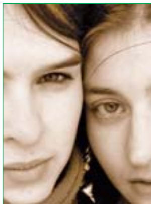
Мама, посмотри в мои глаза...

Еще существует в Самарской области целая сеть различных центров, которые тоже непосредственно относятся к Министерству по семье. Один из таких основных центров – это областной центр «Семья», он имеет свои структурные подразделения в каждом муниципальном образовании Самарской области и замыкает на себе всю профилактику по работе с семьей. Все инновационные проекты и технологии, которые разрабатываются на базе этого центра, внедряются непосредственно на местах, в муниципальных образованиях. В итоге Самарская область вышла на поразительные результаты: на их территории практически нет детей-сирот. Можно сказать, что такого явления, как сиротство, там нет! Там идет борьба за каждого ребенка. И даже за еще нерожденного ребенка – разговор идет о будущей матери, которая только обозначает, что хочет отказаться от ребенка. Как только поступает сигнал, что беременная женщина планирует в будущем оставить ребенка, с ней начинают работать специалисты – психологи и социологи, задача которых – свести риск сиротства к минимуму. Отслеживаются и мамы из «группы риска» – несовершеннолетние, например. И в последствии глобальная задача министерства, которую они ставят перед собой – воспитать