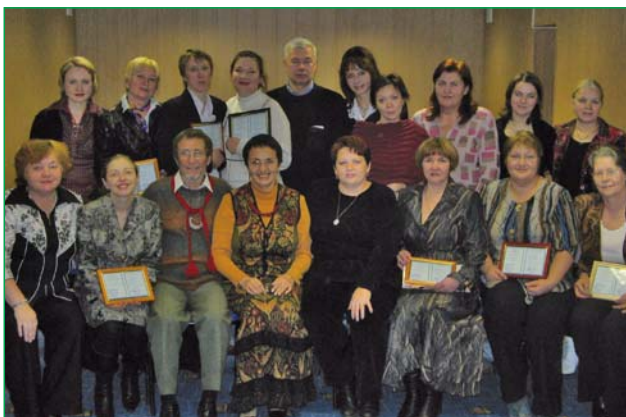
Выпускной. Основы родологии получены.

Семья является уникальным социальным институтом, посредником между индивидом и обществом, транслятором фундаментальных ценностей от поколения к поколению, обеспечивающим первичную социализацию. В семье заключен мощный потенциал воздействия на процессы общественного развития. С другой стороны, общество само влияет на семью и определяет ее социокультурные особенности.