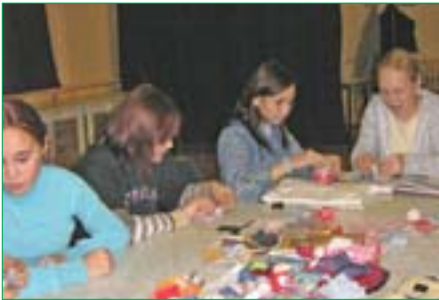
Момент сотворения куколки

Кукла и игра, традиции и устное народное творчество, формирование трудовых навыков и знакомство с видами декоративно-прикладного искусства.