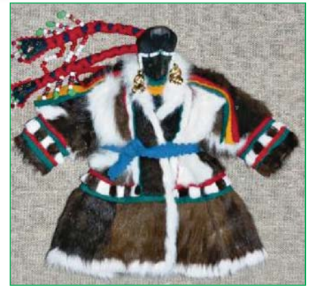
Ненецкая кукла ухуко

Кукла... В нашем представлении её образ тесно связан со стихией игры, с ребенком. Между тем, играя с куклами, наши малыши оказываются хранителями наследия далёкого Детства Человечества. Куклы возникли в глубокой древности и вовсе не для того, чтобы в них